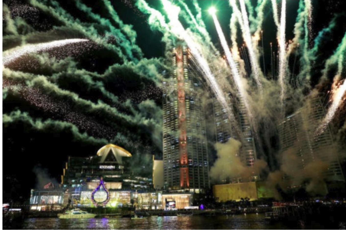
Åbningen af IconSiam i november 2018 blev markeret med fyrværkeri og andre festligheder, der menes at have kostet næsten 200 mio. kroner. Det er verdens fjerdestørste shoppingcenter, kun overgået af tre megacentre i Kina. &nbsp;nsbp;

Siam Paragon indeholder for eksempel også multiplex-biograf og et kæmpeakvarium, mens Siam Discovery beskrives som en hybrid mellem et shoppingcenter og et eksperimentarium. Siam Center kalder hun selv et »ideapolis«. Og IconSiam kaldes »fremtidens by«.